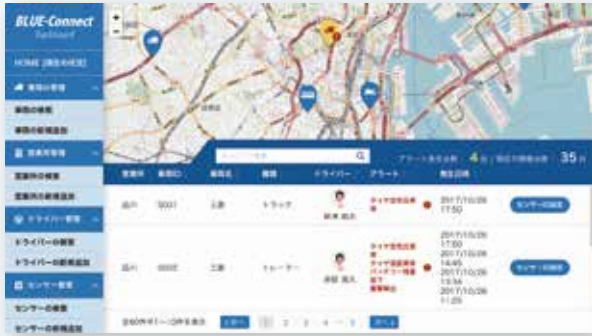
* 開発中の画面です。