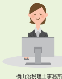
横山治税理士事務所