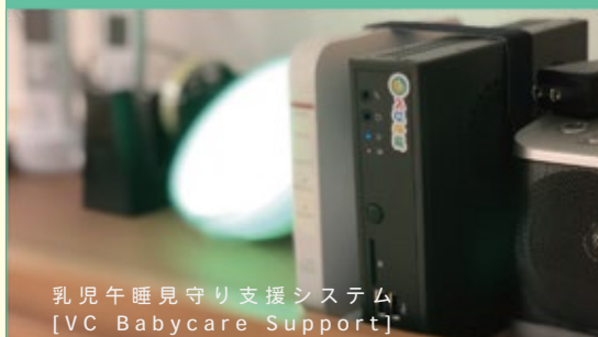
乳児午睡見守り支援システム [VC Babycare Support]

A. このようなシステムは保育士とシステム、もしくは保育士同士でのダブルチェックになりますので保護者のかたも安心して貰えているようです。「お家でも使ってみたい」という声も聞いています（笑）