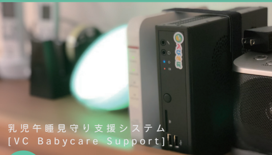
乳児午睡見守り支援システム [VC Babycare Support]